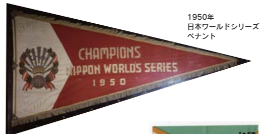
1950年 日本ワールドシリーズ ペナント

終戦後、プロ野球は1945年11月23日から東西対抗を実施。翌46年にはリーグ戦が復活した。50年、8球団によるセントラル・リーグ、7球団によるパシフィック・リーグが誕生、2リーグ制が始まった。この年、最初の日本シリーズが行われ、翌51年からオールスターゲームがスタート。