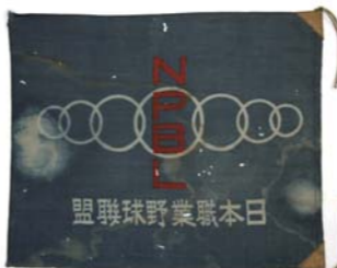
日本職業野球連盟 連盟旗

1936年2月、東京巨人、大阪タイガース、名古屋、東京セネタース、阪急、大東京、名古屋金鯱の7球団により日本職業野球連盟創立。初年度は巨人とタイガースが首位となり、洲崎球場で優勝決定戦が行われ、巨人が2勝1敗で優勝。