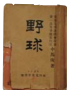
『野球』 1897年 中馬庚 著

1896年5月、一高(第一高等学校)は横浜在住の外国人チームとの試合に29対4で勝利。この勝利が新聞で報じられ、野球人気が全国的に高まった。