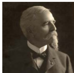
ホーレス・ウィルソン