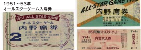
1951～53年 オールスターゲーム入場券